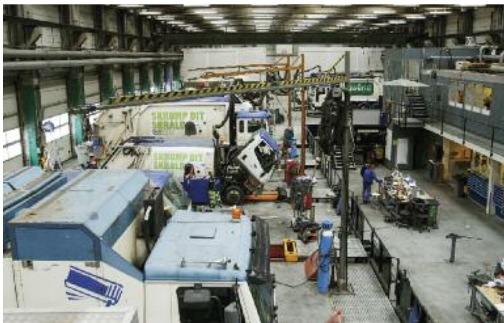
▲ Vue over R98 værkstedet, som lukkes med udgangen af april.

Bl.a. bliver størsteparten af vognparken i R98 skrottet og resten sendt til Afrika. Mange af de 150 R98-biler kører med partikelfiltre, men Københavns Kommune har i udbudsmaterialet forlangt, at de private vognmænd stiller med nye vogne med euro 5-motorer, den mindst forurenende dieselmotor i dag. Og de kører med ad blue i stedet for partikelfiltre. Det giver en bedre forbrænding i motoren, så den forurener mindre".